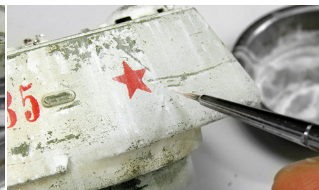
Vékony ecset segítségével kosz megfolyásokat is tudsz készíteni.