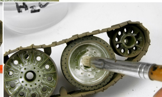
Miután megszáradt, csapvízzel nedvesített kemény sörtéjű ecsetet használjunk azokon a területeken, ahol szeretnénk a fehér színtől megszabadulni.