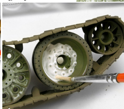
Egyenesen a tégelyből fogjuk alkalmazni a festéket.