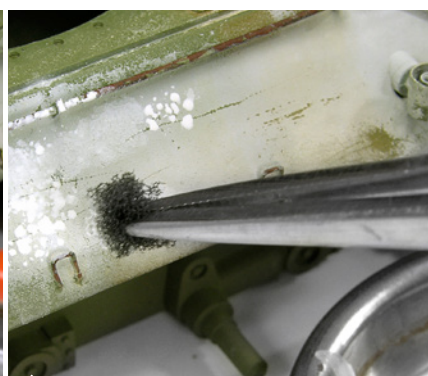
...vagy egy szívacs segítségével foltokban alkalmazzuk azt.