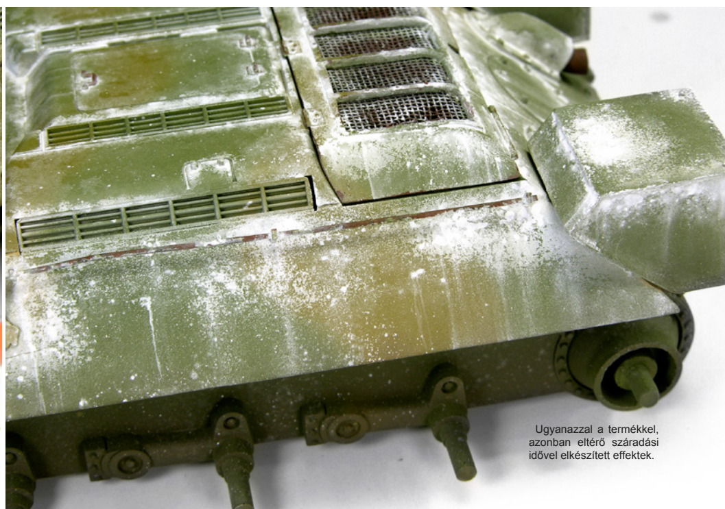
Ugyanazzal a termékkel, azonban eltérő száradási idővel elkészített effektek.

A fehér szín fakultságát, illetve az eső által történt kopását tudjuk imitálni, ha száradás előtt egy nagy köreget használatával eltávolítjuk a nem kívánatos festett részeket. Ügyeljünk a száradási időre, mert az akril festék hagyhat maga után némi festéknyomokat, amelyeket nehéz eltávolítani.