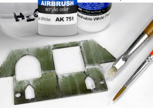
Egy páncéllemezen a mosható fehér szín hatása.

(kemény sörtéjű ecset, fogpiszkáló, vagy tű) segítségével. Felhasználhatjuk ecset vagy festékszóró segítségével. Az alapszínre való felvitele után tökéletes téli álcaszíneket, illetve azok fakóbb árnyalatait készíthetjük el.